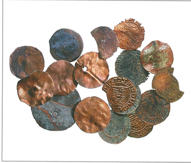
A baracsi hamisító műhely leletai

A mohácsi csata utáni zűrzavaros időszakban nem ismerjük a sorsát, valószínűleg rövid időre elhagyhatták lakói. A török és magyar forrásokból azonban annyit megtudunk, hogy a 16. század közepétől annak végéig bizonyosan lakták. Ezek közül különösen érdekes egy 1558-as irat, mely szerint Miksa főherceg a hűtlen Gyukeffy Boldizsártól elvette Baracsot és Tabdy Antalnak adta. A forrásból nem derül ki, pontosan milyen hűtlenséget követett el a falu birtokosa. A választ talán azokból a tárgyakból következtethetjük ki, melyeket az elmúlt években múzeumbarát fémkeresősök segítségével gyűjtöttünk Baracs területén.