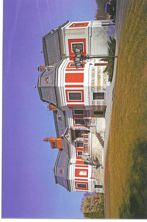
A Vörös-kastély tornyába épített templomkövek

SZABÓ KÁLMÁN: Az alföldi magyar nép művelődéstörténeti emlékei , Budapest 1938.